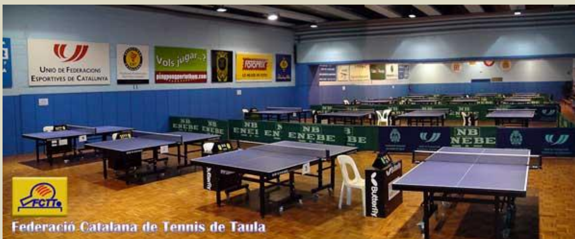
Federació Catalana de Tennis de Taula