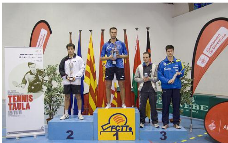
Guanyadors de 2011

Servei de Premsa de la FCTT Tel. 93.280.03.00 // 646.664.724 Barcelona, 1 de novembre de 2012